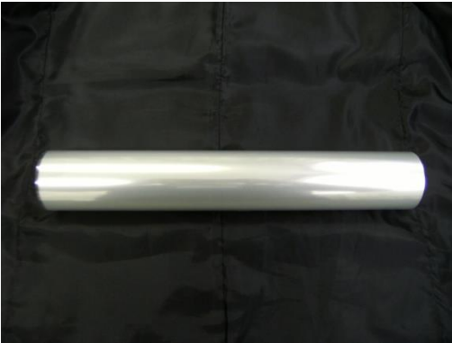
OHP 用 (透明)