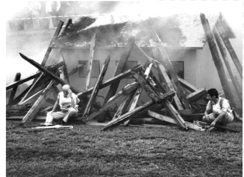
②リアル！崩れた建物の前で救助を待つシーン