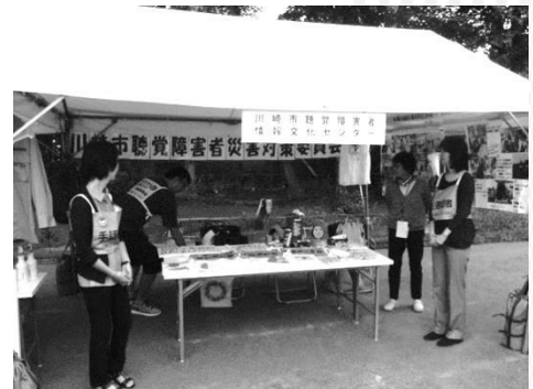
①毎年恒例の災害コーナー

②多摩区在住のろう者・難聴者・手話サークルメンバー・要約筆記者は、メイン会場の応急救護訓練に参加。2名の聴覚障害者が負傷者役となりました。初期消火訓練にも、地域の方々と共に参加しました。訓練の後半は避難所開設訓練が行われている稲田中学校に移動。一般参加者とともに、支援物資を体育館内に運び入れる訓練もやりました。また、医療チーム（医師・看護師・薬剤師）が、ろう者の避難者への健康状態の聞き取りを行う場面では、医療スタッフが通訳を要請し、手話通訳者が入りました。